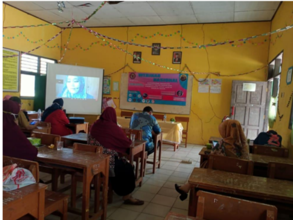
Gambar 1. Suasana kelas ketika PKM berlangsung

PkM ini terselenggara atas kerjasama Guru-guru di Sekolah Dasar Teranggana, Dosen-dosen Universitas Bina Bangsa dan Mahasiswa – mahasiswa yang sedang KKM. Sebelumnya guru-guru mengeluhkan di antaranya: