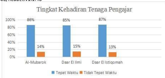
Sumber : Data Absensi Tenaga Pengajar pondok pesantren di Kota Serang