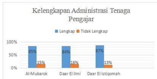
Grafik 1 Kelengkapan Administrasi Sekolah

Namun pada kenyataannya, kinerja guru di beberapa sekolah atau pondok pesantren masih kurang, hal ini terlihat pada syarat administrasi sekolah yang masih belum terpenuhi secara keseluruhan. Berikut beberapa data kelengkapan administrasi sekolah pondok pesantren dikota Serang :