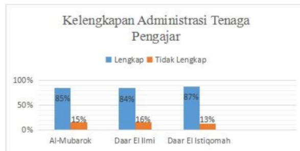
Grafik 1 Kelengkapan Administrasi Sekolah

Namun pada kenyataannya, kinerja guru di beberapa sekolah atau pondok pesantren masih kurang, hal ini terlihat pada syarat administrasi sekolah yang masih belum terpenuhi secara keseluruhan. Berikut beberapa data kelengkapan administrasi sekolah pondok pesantren dikota Serang :