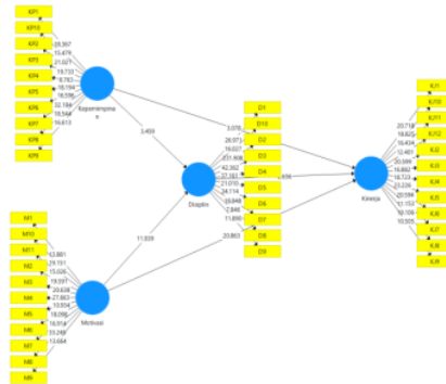
Gambar 2 Uji signifikansi Model

Pengujian Hipotesis dilakukan berdasarkan hasil pengujian Inner Model (model struktural) yang meliputi output r-square , koefisien parameter dan t-statistik. Untuk melihat apakah suatu hipotesis itu dapat diterima atau ditolak diantaranya dengan memperhatikan nilai signifikansi antar konstruk, t-statistik, dan p-values. Pengujian hipotesis penelitian ini dilakukan dengan bantuan software SmartPLS ( Partial Least Square ) 3.0. Nilai-nilai tersebut dapat dilihat dari hasil bootstrapping . Rules of thumb yang digunakan pada penelitian ini adalah t-statistik >1,96 dengan tingkat signifikansi p-value 0,05 (5%) dan koefisien beta bernilai positif. Nilai pengujian hipotesis penelitian ini dapat ditunjukkan pada Tabel dan untuk hasil model penelitian ini dapat digambarkan seperti tampak pada